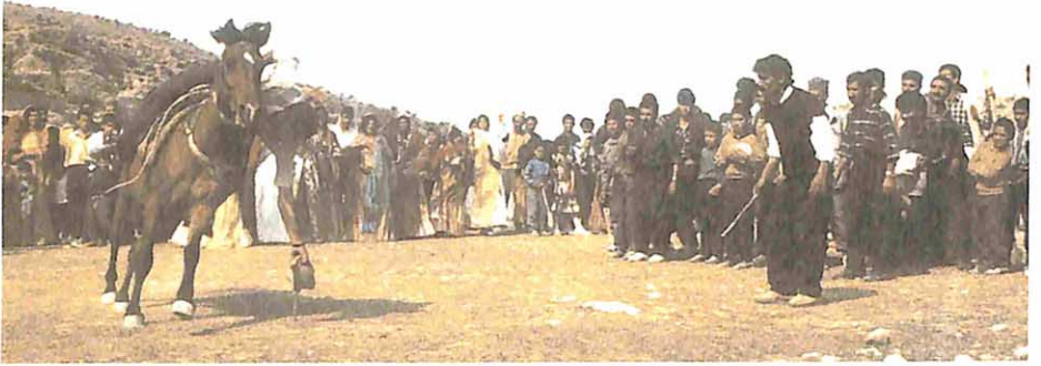
Yöresel oyunda "hababah" çeken seyirciler